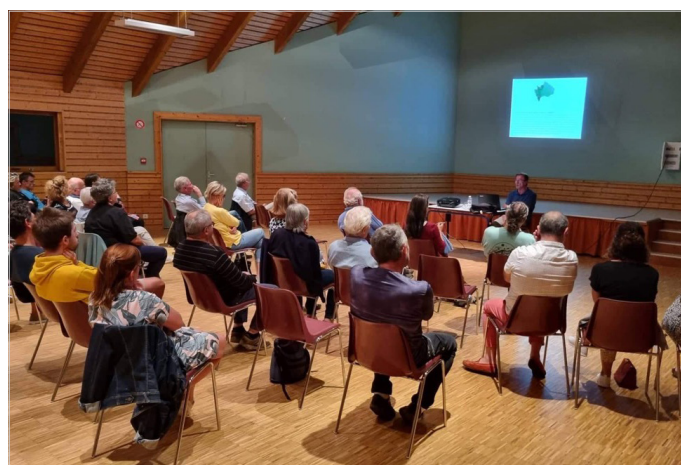
Soirée langues régionales à St Sauveur de Peyre le 29 août