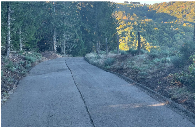
Rénovation chemin Chapchinès