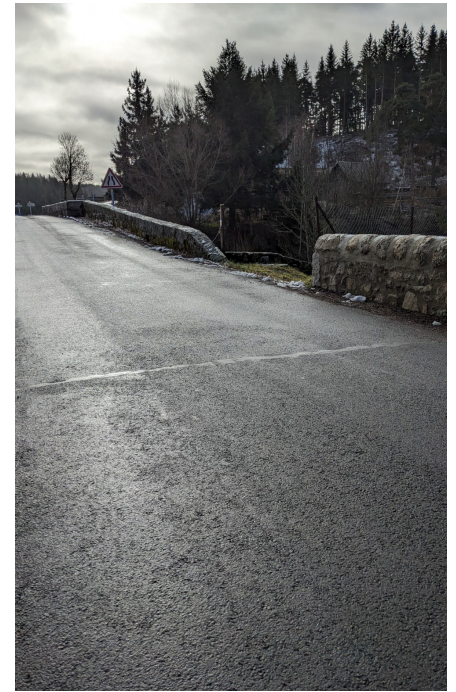
Travaux voirie RD Javols