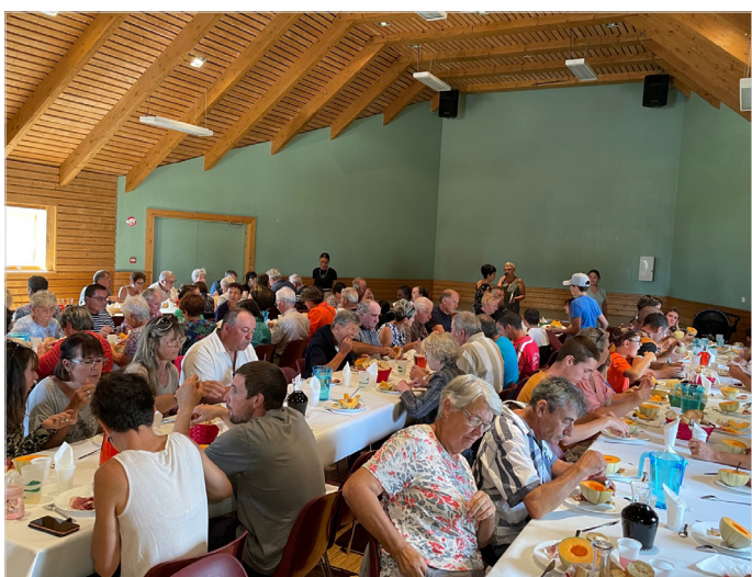
Repas pour la fête à St Sauveur de Peyre le 21 août