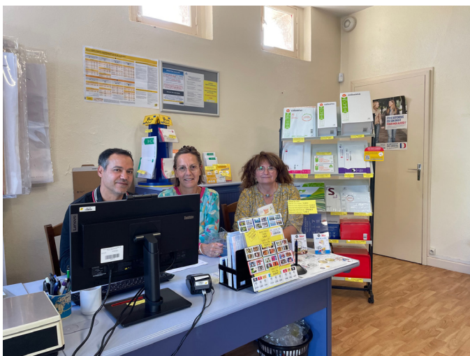
APC provisoire à St Sauveur