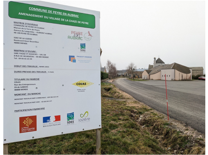
Aménagement La Chaze de Peyre