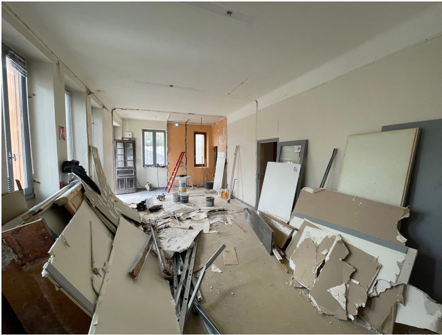
Travaux Agence Postale à St Sauveur