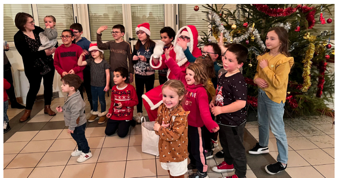
Le Père Noël à l'école de Sainte Colombe !

Pour beaucoup d'entre eux, c'était une première, un voyage qu'ils n'oublieront pas de sitôt !