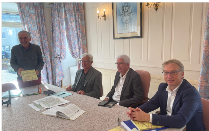
Présentation du livre «Les Seigneurs de Peyre» à Aumont-Aubrac