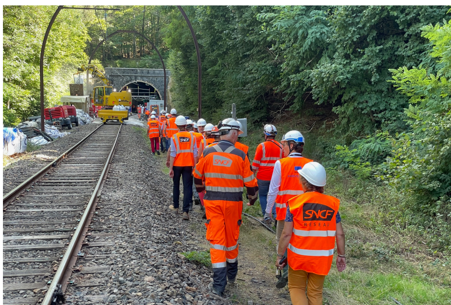
Visite tunnel de Grifoulière à St Sauveur