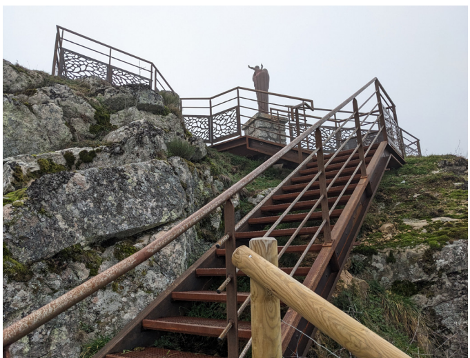
Aménagement Roc du Cher