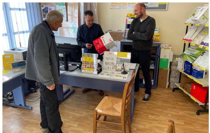
Mutualisation remplacement pour les APC de St Sauveur et Javols