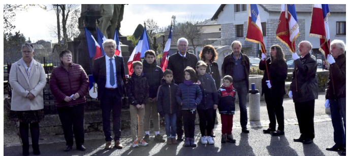
Cérémonie du 11 novembre à St Sauveur