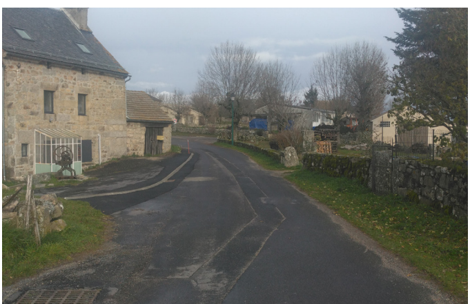
Travaux voirie au Cher