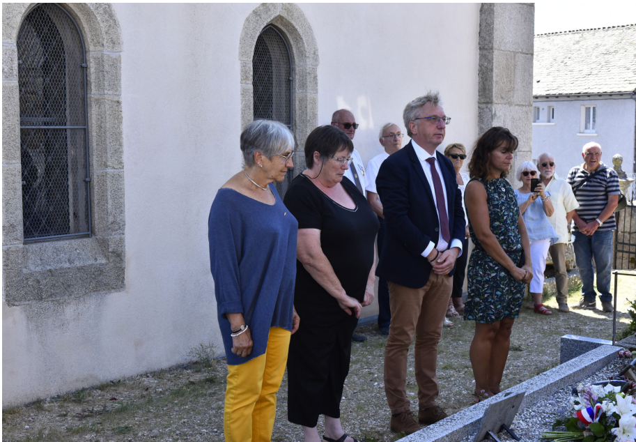
Cérémonie 11 août 2022 à St Sauveur