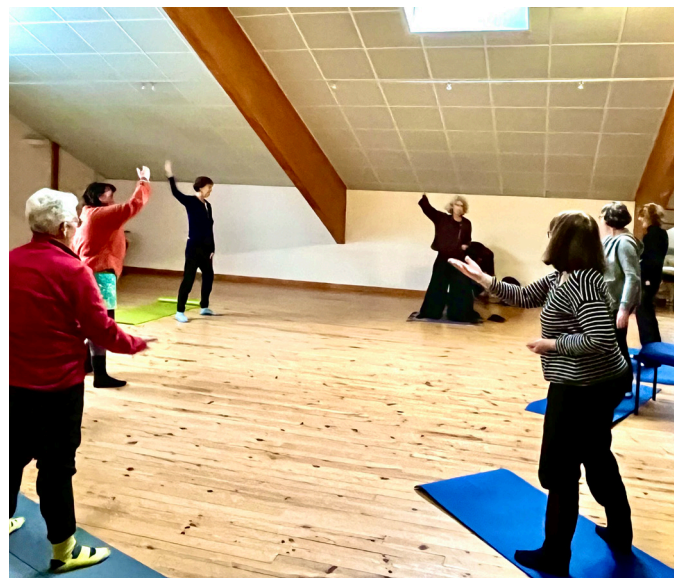
Atelier Qi Gong