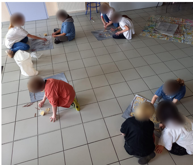
Atelier arts plastiques « Les sansonnets »