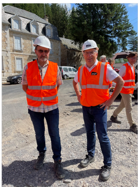
Visite tunnel de Grifoulière à St Sauveur