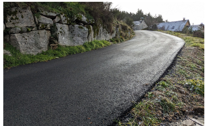
Programme voirie Javols : Le Régimbal, Volpillac et le Mas Neuf