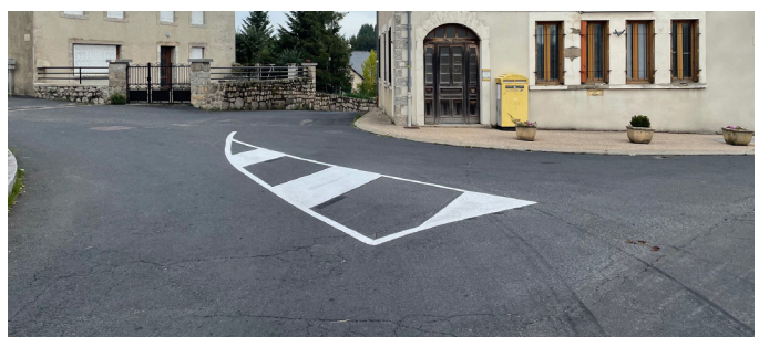
Signalisation horizontale St Sauveur