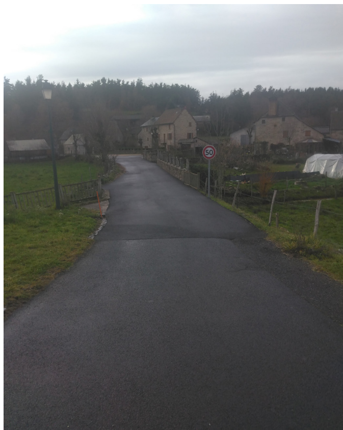
Travaux programme voirie à Couffinet