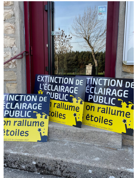
Extinction de l'éclairage public à St Sauveur