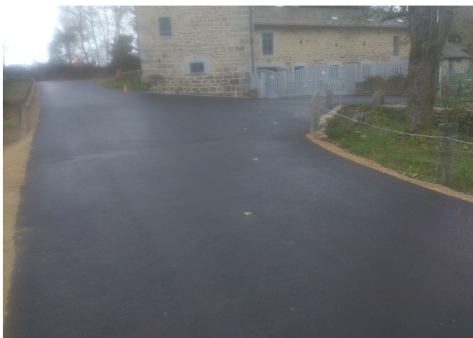
Travaux voirie - enfouissement réseaux secs au Ventouzet