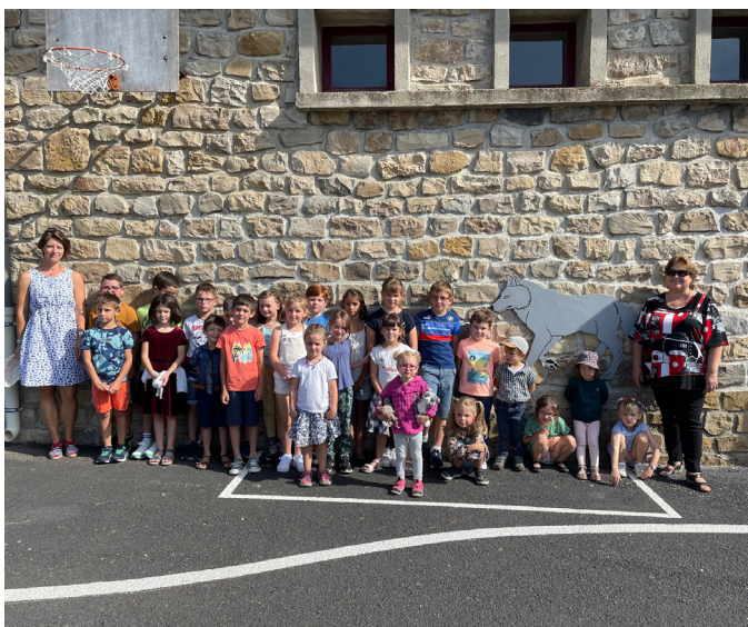
Rentrée à l'école publique de St Sauveur